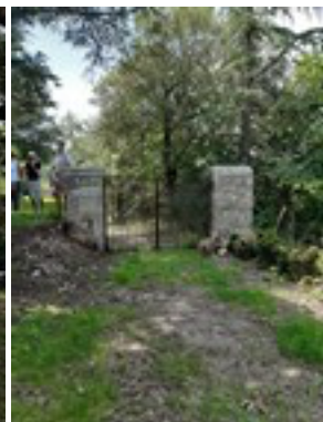
Le jardin : statue, bassin, gloriette, portail...