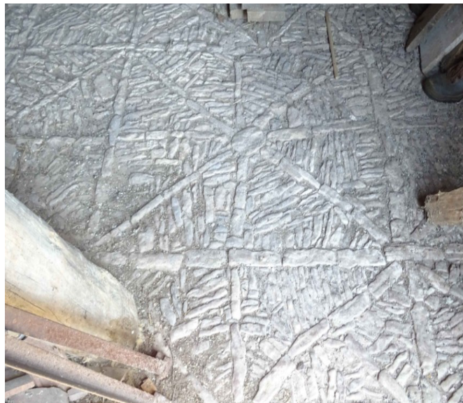
DETAIL DE SOL EN PISE

Cette absence doit être corrigée afin que le patrimoine paysan soit reconnu en tant qu'expression d'une culture, mais aussi pour préserver le sens du « grand » patrimoine monumental dont il est le complément indissociable.