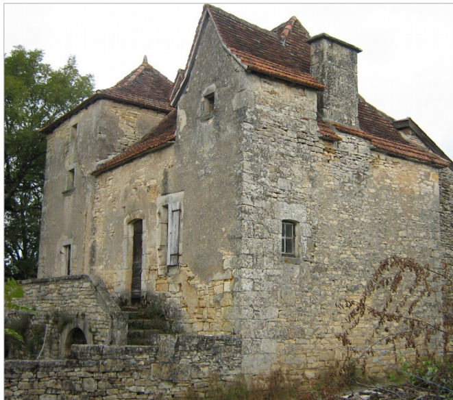
CAUSSE DE GRAMAT

Il est très singulier de constater que cette catégorie d'édifices est quasiment absente du corpus des monuments historiques et autres outils de protection du ministère de la Culture (sinon en tant qu'objet exceptionnel, pigeonnier isolé par ex.), corpus presque exclusivement composé d'édifices nobiliaires, religieux, publics et bourgeois, alors que l'architecture paysanne est un marqueur essentiel de nos territoires et un témoin majeur de la culture populaire.