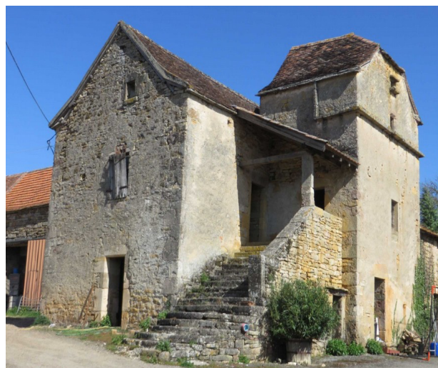
CAUSSE DE LIMOGNE